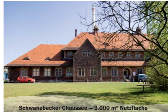
Schwanebecker Chaussee – 9.000 m 2 Nutzfläche