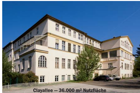
Clayallee – 36.000 m 2 Nutzfläche