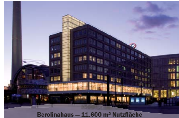
Berolinahaus – 11.600 m 2 Nutzfläche