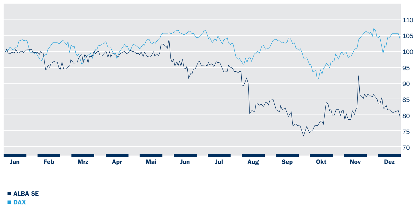
ALBA SE vs. DAX. Indizierter Aktienvergleich 2014